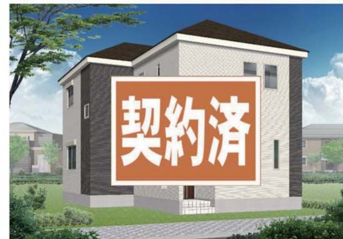
※図はイメージです。