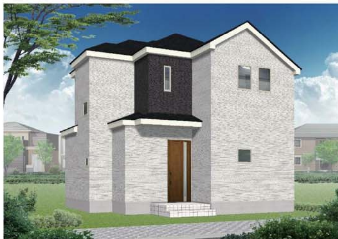
※図はイメージです。