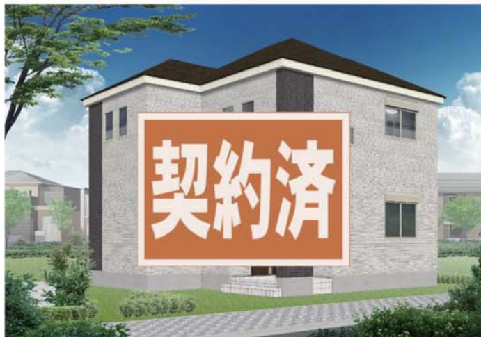
※図はイメージです。